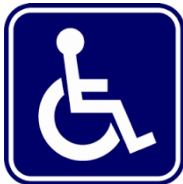
สัญลักษณ์ผู้พิการ